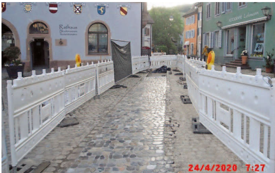
Behindertengerechtes Pflasterband am Marktplatz

Die Stadtverwaltung Staufen und die beteiligten Firmen bedanken sich insbesondere beim Einzelhandel, den Anliegern und den Marktbesuchern für ihr Verständnis während der Bauzeit.