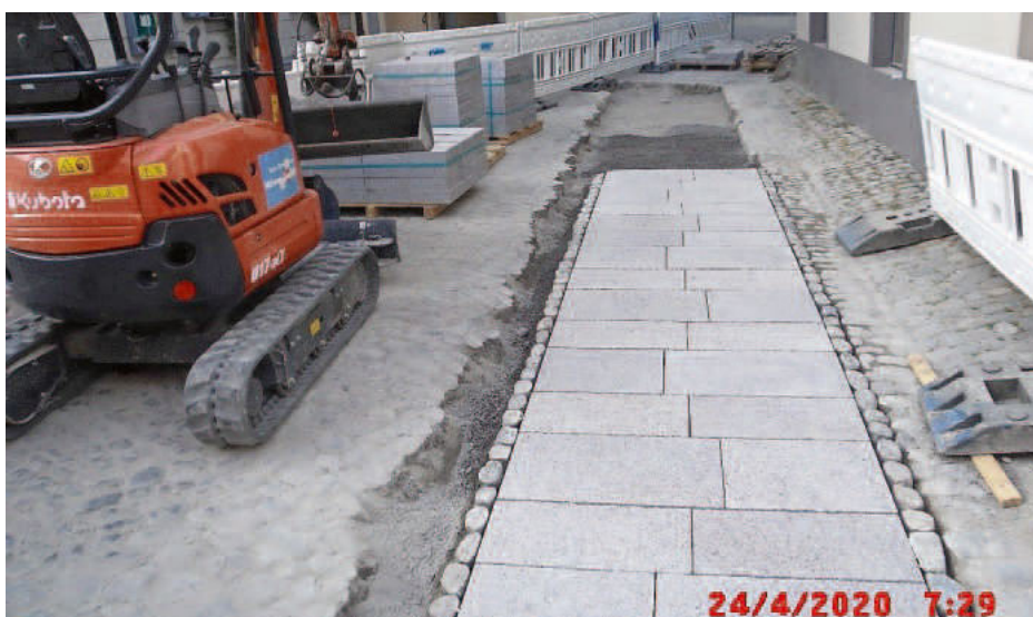
Behindertenfreundliche Übergangsabschnitte in die Hauptstraße