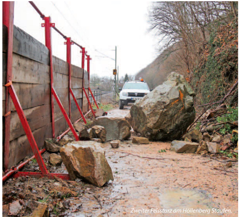
Zweiter Felssturz am Höllenberg Staufen.

In der Nacht zum 21. Januar 2021 hat es als Naturereignis einen Steinschlag am Höllenberg außerorts zwischen der Fachklinik Haus Münstertal und Etzenbach gegeben. Dabei löste sich ein Fels und Steine und stürzten talwärts auf den Wirtschaftsweg am Hangfuß. Das Landesamt für Geologie, Rohstoffe und Bergbau (Regierungspräsidium Freiburg) wurde informiert und hat unmittelbar eine ingenieurgeologische Untersuchung vorgenommen. Aufgrund der bestehenden Gefährdung wurde daraufhin kurzfristig die Fachfirma Alpina, Waldkirch, mit ersten Sofortmaßnahmen zur Räumung von gelockerten Felsstücken und totem Bruchholz tätig. Des Weiteren wurden Vorbereitungen zum kontrollierten Abtrag eines weiteren absturzgefährdeten Felsblockes (ca. 1,5 m 3 ) getroffen. Nach dem Steinschlagereignis wurde unmittelbar die SWEG hinsichtlich der Münstertalbahn informiert, die vorsorglich an der Abbruchstelle eine Langsamfahrt eingerichtet hat. Der Wirtschaftsweg am Hangfuß wurde für Verkehr und Fußgänger/Radfahrer sofort gesperrt.