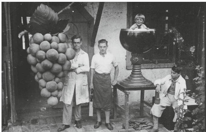
BA 2005/639: Weinfest in Staufen, o. J. (vor 1950)

Eintritt frei, Anmeldungen bei der Sektion Bad Krozingen-Staufen, Breisgau-Geschichtsverein unter: staufen@breisgau-geschichtsverein.de oder telefonisch im Stadtarchiv Bad Krozingen: Tel. 07633 407 171.