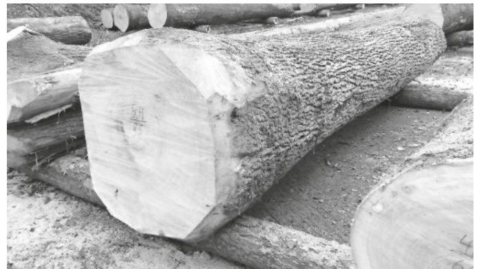
Zum Foto: Auf dem Müllheimer Submissionsplatz konnten Holzkunden von Anfang Januar bis zum Submissionstag am 27.01. 2022 die angebotenen Stämme begutachten