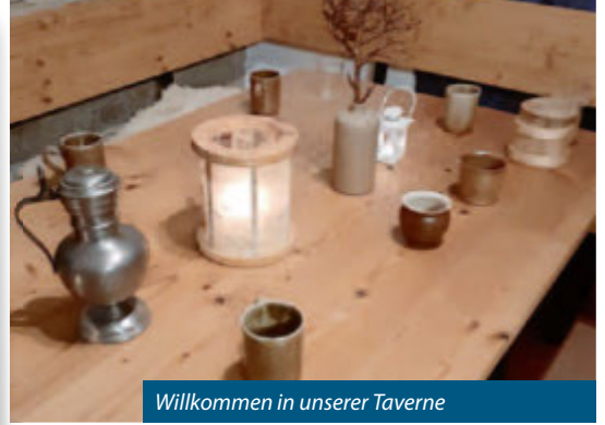
Willkommen in unserer Taverne

Die Schule hat nun begonnen und der Herbst stellt sich so langsam ein. Da erinnern wir uns doch gern noch an die Sommerferien und blicken auf einige interessante Wochen und Tage zurück. Vielen Dank an alle Kinder und Jugendliche, die dabei waren. Es hat uns sehr viel Spaß mit Euch gemacht. In der ersten Ferienwoche haben wir uns mit einer Gruppe Kinder und Jugendliche in eine Selbstversorgerhütte nach St. Blasien begeben. Dort lebten wir 5 Tage zusammen in einer Hütte und unter freiem Himmel, kochten zusammen, spielten und waren kreativ. In der zweiten Ferienwoche hieß es dann „Spiel, Spaß und Freizeit“ Beim Fantasy-Rollenspiel verwandelte sich das „JuZe“ in eine Taverne und wir begaben uns als eine Schar von Heiler*innen und Krieger*innen nach Mitteleuropa, um den besonderen „schwarzen Stein“ zurück zu erobern. Beim Wikinger-Lager am 8. und 9. September tauchten wir ein in die Welt der Nordmänner und -frauen. Auf dem Programm standen Bogenschießen, Schmuck-Herstellen, Rundschilder bemalen, Schwertkampf, Fladenbrot backen, Butter herstellen, Kammweben und weitere Spiele.