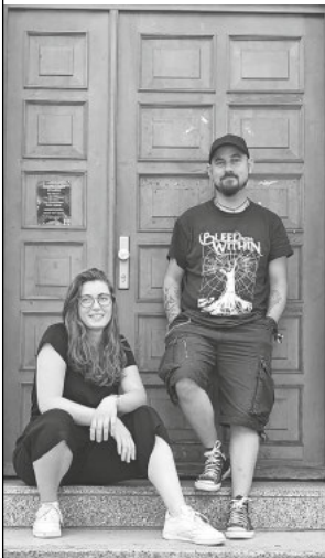
Team der Jugendarbeit Staufen

Neben den genannten Angeboten sind wir auch „mobil“ in Staufen unterwegs und ansprechbar für Eure Anliegen. Weitere Angebote und Projekte sind in Planung. Änderungen sind möglich. Infos darüber gibt's auch auf Instagram oder Facebook unter jugendarbeit.staufen.