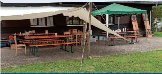
Ferienlager in St. Blasien