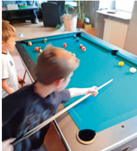
Auch Spiel, Spaß und Freizeit kamen nicht zu kurz