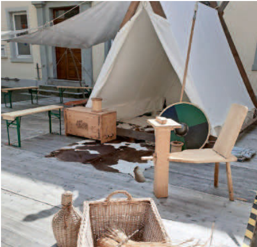
Im Lager der Wikinger