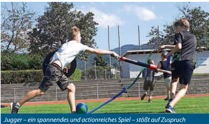
Juggo – ein spannendes und actionreiches Spiel – stößt auf Zuspruch