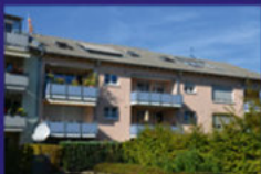
VA, 64,0 kWh, Gas, Bj. 2006

Helle und freundliche Wohnung in Bahnhofsnähe. 1.OG mit Aufzug, großer Balkon, Bad mit Wanne, Gäste-Bad, Keller u.v.m.