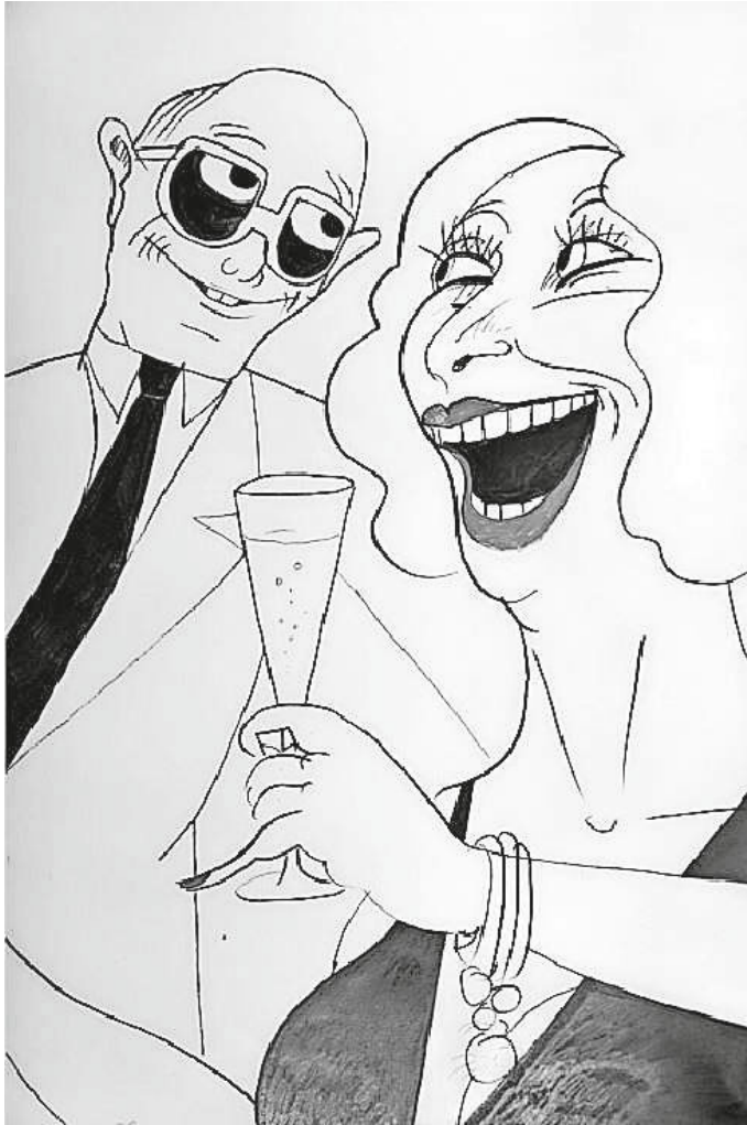
Tomi Ungerer - Ohne Titel, Bleistift/Filzstift, 60 x 40 cm (Werk 169)

Eine Zeichnung aus seinem vielfältigen Werk war Teil der Kunstauktion „Künstler für Staufen“, deren Erlös den Rissgeschädigten unserer Stadt zugute kommt. Sie befindet sich noch im Besitz der Stiftung zur Erhaltung der historischen Altstadt Staufen und kann erworben werden. Bei Interesse melden Sie sich gerne telefonisch unter 07633 805-56.